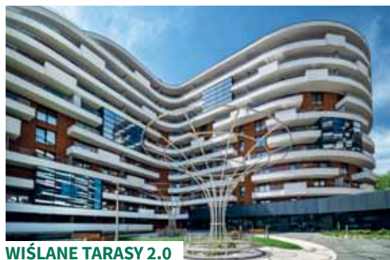
WIŚLANE TARASY 2.0

Osiedle cechuje futurystyczna forma architektoniczna, ekologiczne strefy wypoczynku i inne oryginalne