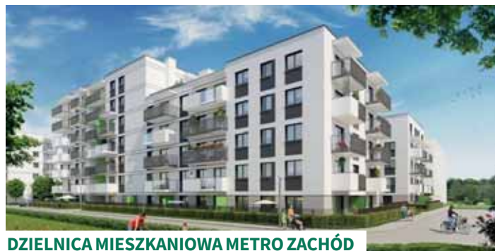
DZIELNICA MIESZKANIOWA METRO ZACHÓD

Dzielnica Mieszkaniowa Metro Zachód stworzona jest dla osób żyjących w rytmie miasta, poszukujących wygody i niepowtarzalnego klimatu. Planowana stacja drugiej linii metra powstaje w samym centrum inwestycji, zapewniając mieszkańcom szybką i łatwą komunikację z centrum miasta. To w pełni funkcjonalna przestrzeń do życia z niezbędną infrastrukturą